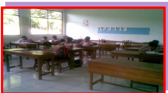
Gambar 4.1 Kegiatan Pembelajaran Berlangsung Secara Klasikal

Gambar 4.1 juga menginformasikan bahwa selama kegiatan pembelajaran guru belum dapat membuat siswa aktif. Setelah siswa selesai mengerjakan soal-soal pada buku paket, kegiatan se-