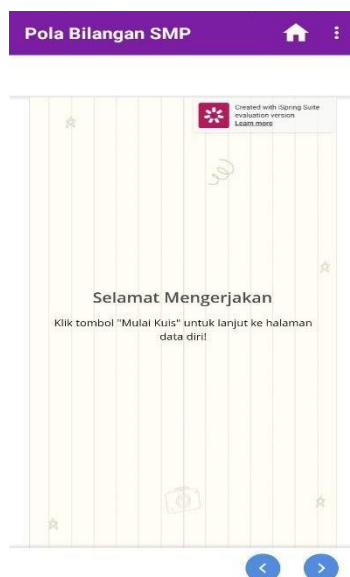
Gambar 8. Latar Aplikasi pada Halaman Kuis

pemilihan latar aplikasi ini, peneliti menggunakan latar atau template berbentuk garis vertikal yang warnanya tidak terlalu mencolok, tidak terlalu ramai namun tetap mempertahankan unsur ketetikan dan keindahan.