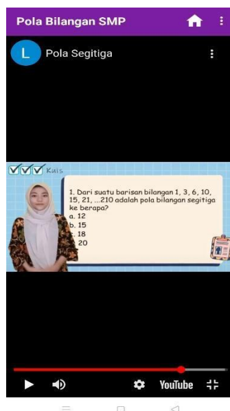
Gambar 3. Video Pembelajaran

itu, guru/tutor pada video juga menjadi nilai plus baik dari sisi penampilan, penjelasan konsep, maupun artikulasi penyampaian materi yang nyaman di telinga sehingga membuat siswa lebih bersemangat memahami materi pola bilangan.