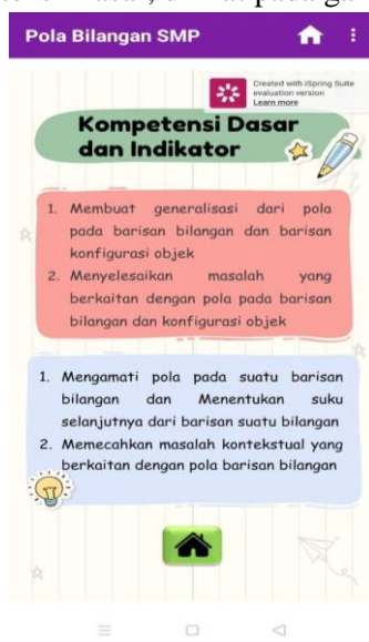
Gambar 10. Halaman KD dan Indikator

Persepsi guru terhadap aspek dalam Kompetensi Dasar sejalan dengan pengorganisasian materi yang dimana terdiri dari kejelasan materi dalam mencapai tujuan pembelajaran. Penyajian pengorganisasian materi ini disampaikan melalui penggunaan bahasa yang baik dan sesuai dengan kaidah EYD sehingga dikategorikan layak. Pada aspek Kompetensi Dasar ini juga terdiri dari beberapa indikator yang berupa kemudahan memahami materi melalui penggunaan bahasa, kelengkapan materi dalam aplikasi sesuai dengan Kompetensi Dasar, dilihat pada gambar 10.