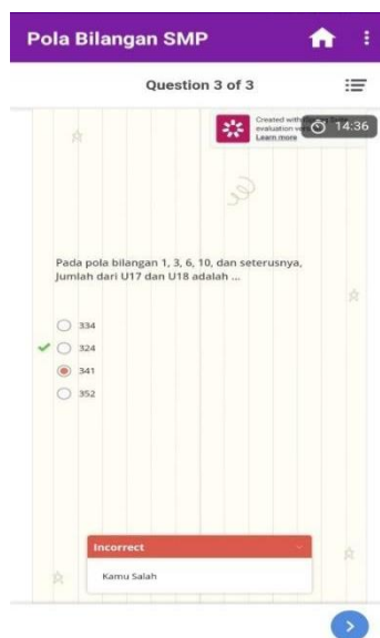
Gambar 9. Tampilan Cover

Adanya animasi audio visual yang menarik pada aplikasi juga membuat siswa lebih semangat untuk belajar yaitu pada gambar 9. Dimana pada halaman kuis/latihan soal, akan muncul tulisan, audio dan lambang benar atau salah dari soal yang telah mereka jawab.