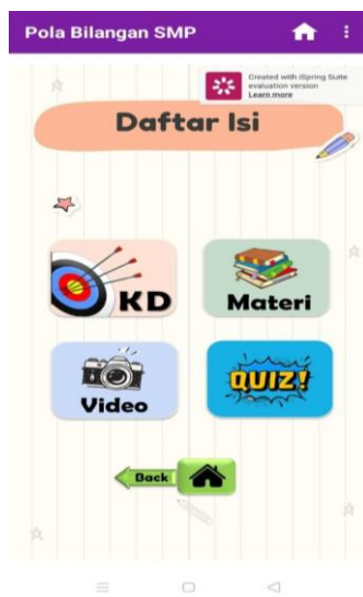
Gambar 5. Halaman Daftar Isi

Kedua, dilihat dari ikon tombol yang mana pada halaman daftar isi (gambar 5) terdapat 4 ikon menu untuk memudahkan siswa menuju halaman yang diinginkan. Pada masing-masing ikon menu memiliki gambar yang menunjukkan identitasnya sendiri, misalnya ikon video diberi gambar kamera. Selain itu, 4 ikon menu ini memiliki ukuran yang sama agar terlihat bagus dan balance.