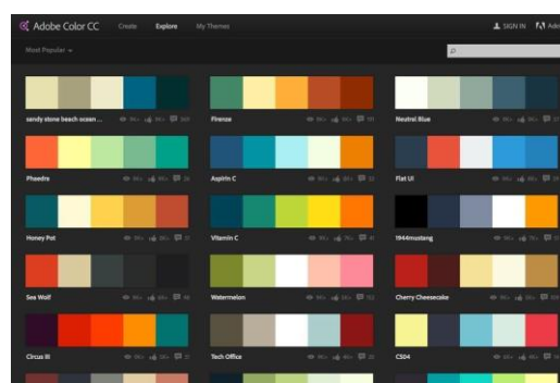
Gambar 7. Kombinasi Palet warna

Keempat yaitu kesesuaian tampilan gambar sehingga tidak memberi informasi ganda yang membuat bingung siswa, misalnya pada gambar pola bilangan segitiga memuat gambar lingkaran yang membentuk bangun segitiga. Lalu pemilihan latar aplikasi yang menarik seperti gambar 8. Dalam