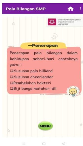
Gambar 2. Isi Materi terkait Definisi dan Penerapan

Kedua, materi pada media pembelajaran ini berkaitan dengan permasalahan kontekstual sehingga dapat menstimulasi siswa untuk memiliki keterampilan pemahaman konsep matematis. Misalnya pada penemuan konsep definisi pola bilangan, disajikan juga contoh penerapan dalam kehidupan yang kita rasakan sehari-hari (pada gambar 2), hal ini bertujuan supaya siswa mendapat gambaran/visualisasi secara langsung di kehidupan nyata.