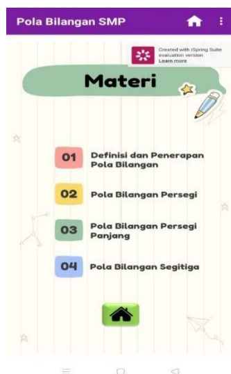
Gambar 1. Halaman pada Menu Materi

Kedua, materi pada media pembelajaran ini berkaitan dengan permasalahan kontekstual sehingga dapat menstimulasi siswa untuk memiliki keterampilan pemahaman konsep matematis. Misalnya pada penemuan konsep definisi pola bilangan, disajikan juga contoh penerapan dalam kehidupan yang kita rasakan sehari-hari (pada gambar 2), hal ini bertujuan supaya siswa mendapat gambaran/visualisasi secara langsung di kehidupan nyata.