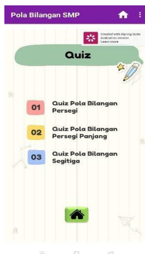
Gambar 11. Halaman Isi pada Menu Quiz

Persepsi guru terhadap aspek bahasa yang digunakan pada media pembelajaran android ini termasuk ke dalam kategori sangat layak. Yang dimana pada kelayakan tersebut dinilai dari kejelasan kalimat atau bahasa yang digunakan, dimana istilah yang digunakan dalam media pembelajaran android ini menggunakan istilah umum dan familiar yang sering di dengarkan siswa sehingga mudah untuk dipahami. Bahasa yang digunakan baik secara tertulis maupun lisan (pada video) tidak menimbulkan makna ganda dan ambigu, komunikatif, tidak bertele-tele serta mudah dipahami siswa. Selaras dengan pendapat Prastowo (2014) seperti yang telah dijelaskan sebelumnya. Video pembelajaran yang disajikan dalam aplikasi juga menggunakan bahasa yang mengajak siswa untuk berimajinasi dan membayangkannya.