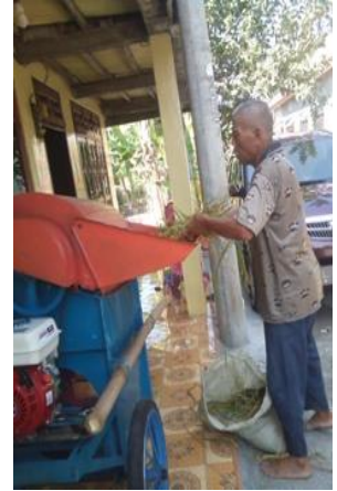
Gambar 7. Deseminasi mesin