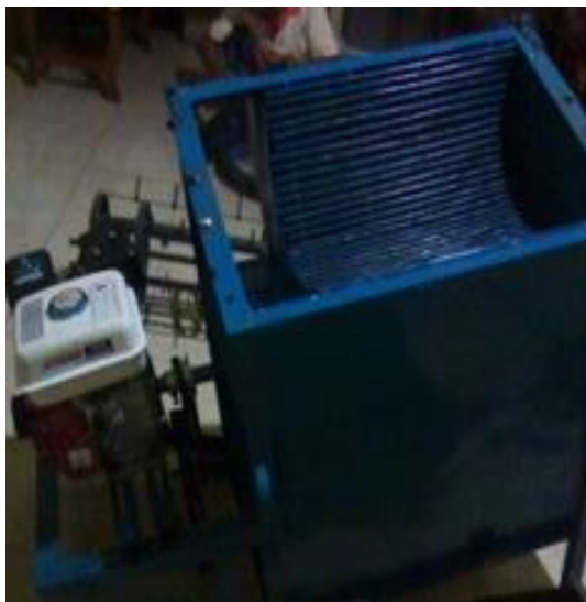
Gambar 5. Mesin penggerak dan pelindung