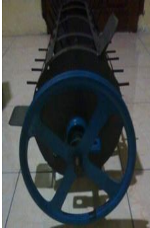
Gambar 4. Blade perontok