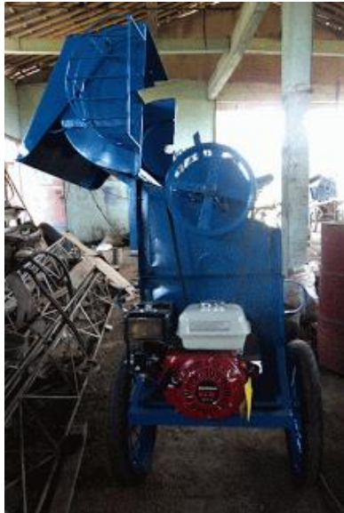
Gambar 1. Mesin Perontok Padi di Pasaran

Sedangkan mesin perontok padi yang ditawarkan yakni berbahan logam bekas yang banyak dilingkungan masyarakat, misalnya kaleng biskuit, bearing, mur-baut, dan baja bekas lainnya sehingga perlu dimanfaatkan menjadi benda yang berfungsi. Mesin perontok padi ini diperkirakan harga yang lebih murah yakni Rp 2.000.000,- hingga Rp 3.000.000,-. Adapun gambar, spesifikasi dan bahan yang direncanakan adalah sebagai berikut.