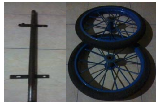
Gambar 3. Poros dan roda

Tahap selanjutnya adalah pembuatan komponen-komponen mesin. Komponen yang dibuat ditunjukkan pada gambar dibawah ini.