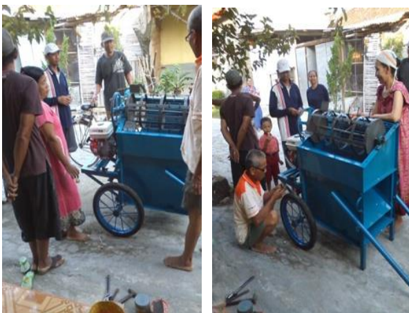
Gambar 6. Deseminasi mesin

Setelah mesin dibuat maka didesimikan kepada mitra. Foto kegiatan ditampilkan berikut ini.