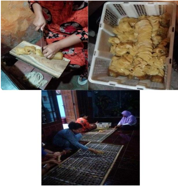
Gambar 1. Proses Produksi Kerupuk Bawang Mentah