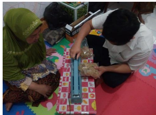
Gambar 6. Pelatihan Penggunaan Hand Sealer oleh Tim PKM UNIKAMA