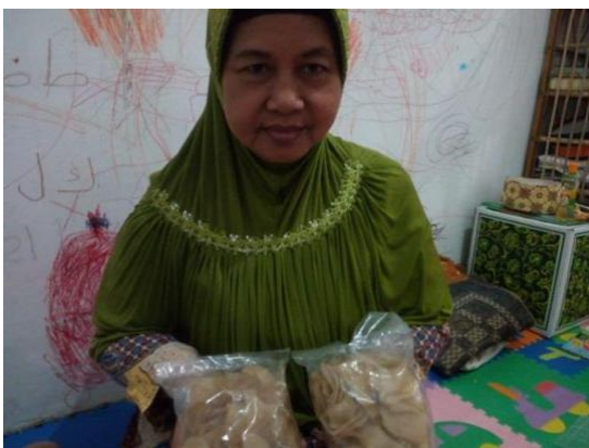
Gambar 8. Hasil Pengemasan Kerupuk Bawang Mitra

Kegiatan workshop ini diikuti oleh mitra dengan didampingi oleh keluarga yang membantu mitra dalam proses produksi kerupuk bawang yaitu 2 orang. Dalam kegiatan ini, respon mitra sangat baik dan penuh perhatian. Mitra mengikuti setiap penjelasan Tim PKM UNIKAMA dalam pelatihan proses pengemasan ini. Selanjutnya, Tim PKM meminta mitra untuk mencoba sendiri mesin tersebut. Pada saat mencoba secara langsung penggunaan mesin tersebut, mitra masih mengalami kesusahan. Plastik yang digunakan untuk mengemas kerupuk bawang berkali-kali sobek karena mesin yang terlalu panas. Namun hal tersebut, dapat segera diatasi. Tim PKM memberikan penjelasan agar mitra terlebih dahulu mengatur panas mesin sehingga panas sesuai dan tidak merusak plastik yang digunakan untuk mengemas.