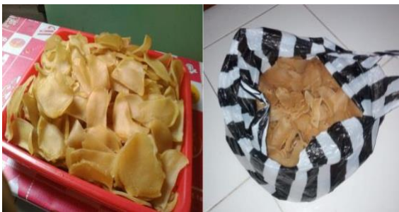
Gambar 2. Produk Kerupuk Bawang Mitra

Pada UKM tersebut, proses pengemasan masih dilakukan dengan sangat sederhana. Seperti yang dapat dilihat pada gambar 2. Kerupuk dipesan oleh pelanggan dan dikemas dalam kresek plastik. Jika pemesanan banyak sampai 30 kg, mitra menggunakan plastik kresek berukuran besar.