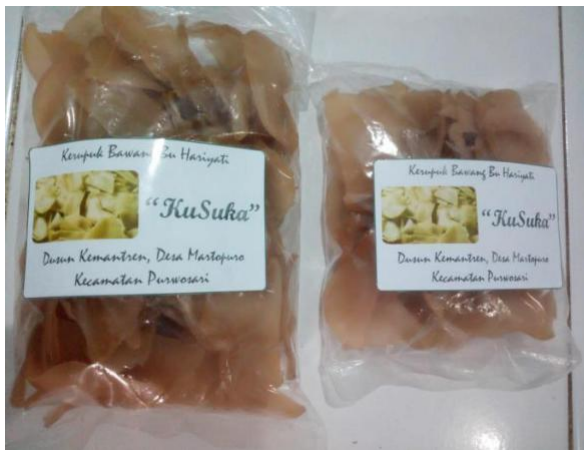
Gambar 5. Desain Merk Dagang Kerupuk Bawang