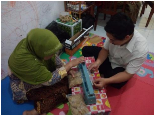
Gambar 7. Pelatihan mandiri mitra dengan didampingi oleh Tim PKM UNIKAMA