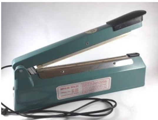
Gambar 4. Mesin Hand Sealer

Dalam kegiatan pengabdian masyarakat ini, akan dilakukan workshop dan pendampingan secara langsung bersama mitra dalam pelatihan packing process produk kerupuk bawang mitra dengan menggunakan mesin hand sealer .