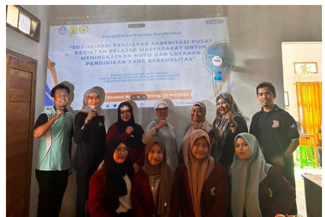
Gambar 3. Dokumentasi Kegiatan