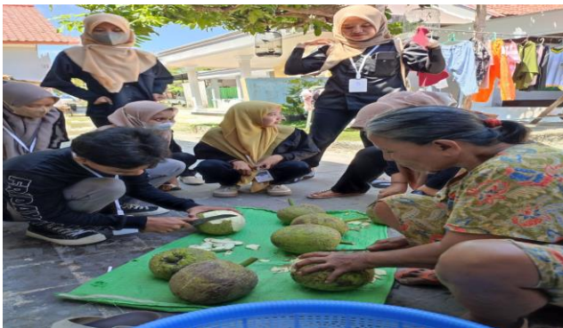
Gambar 1. Survey lokasi

Survey diadakan pada tanggal 18 September 2023 di Desa Bunder guna untuk mengetahui situasi dan kondisi UMKM. Dari hasil survey ditemukan bahwa ada tiga pelaku UMKM yang dianggap cukup besar seperti UMKM kripik pisang dan talas, kripik sukun, dan jamur tiram. Namun, penjualan yang dilakukan masih menggunakan sistem manual, hal ini dikarenakan mereka masih kurang mengikuti perkembangan teknologi.