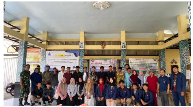
Gambar 6. Keterlibatan pelaku UMKM dan remaja desa dalam pelatihan pembuatan Google Maps