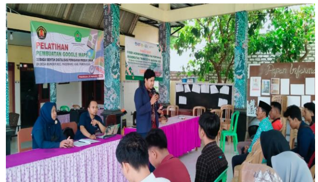
Gambar 2. Pemateri menjelaskan pembuatan Google Maps

Pada sesi ini, peserta UMKM diminta oleh pemateri untuk masuk ke Google Maps dengan memakai akun google yang sudah dimiliki, jika memakai HP pilih menu kontribusi, jika memanfaatkan laptop/PC pilih garis tiga di bagian pojok kiri atas, pencet bagian tambah tempat (input nama lokasi, kordinat, dan detail lainnya), lalu pilih pencet selesai, kemudian diminta menunggu konfirmasi dari Google Maps selama tiga hari bahkan sampai tujuh hari, setelah peserta mendapatkan notifikasi dari Google Maps, maka peserta atau pelaku UMKM bisa mengupload produk-produknya melalui Google Maps tersebut.