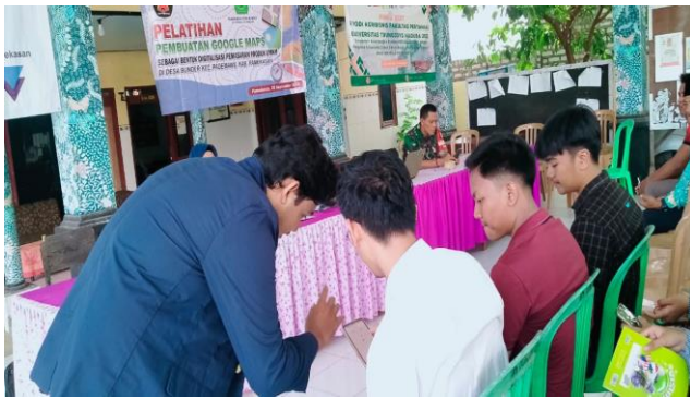
Gambar 3. Pembuatan Google Maps oleh peserta pelatihan