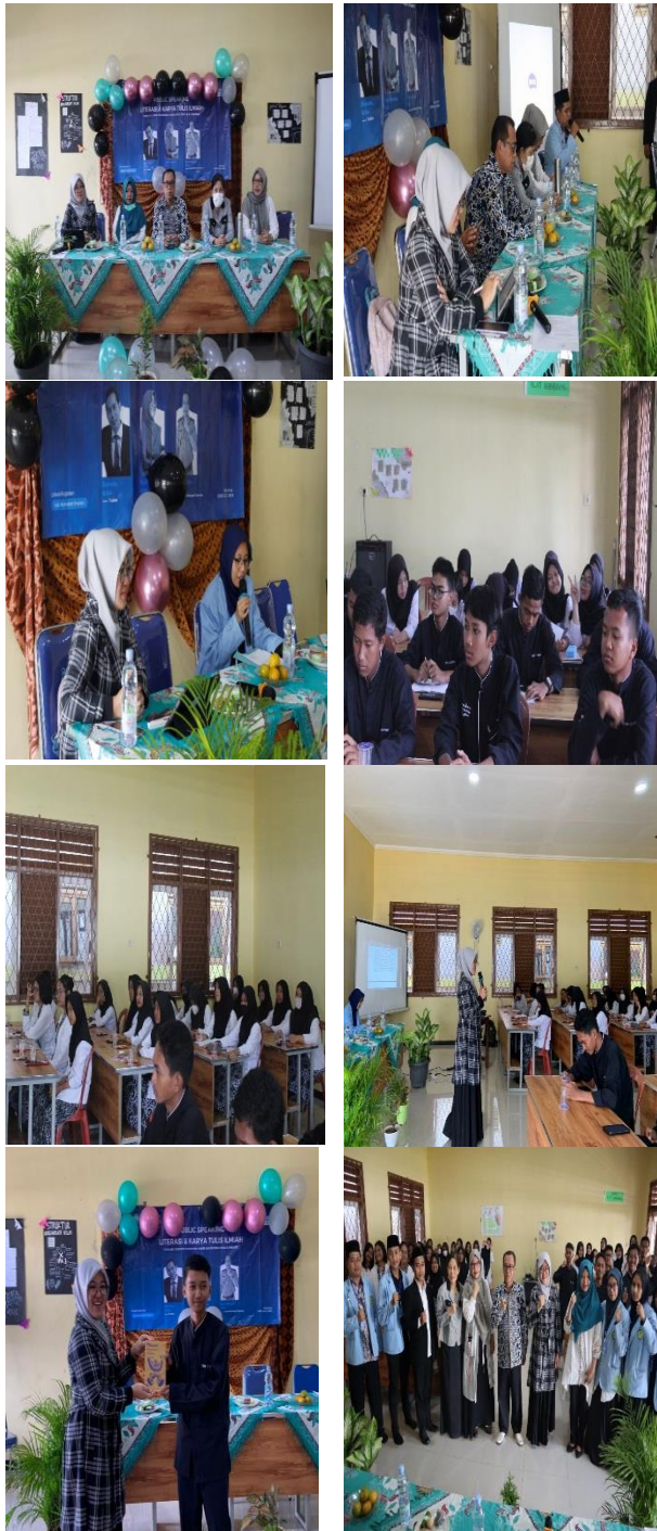
Gambar Kegiatan yang Terdokumentasikan