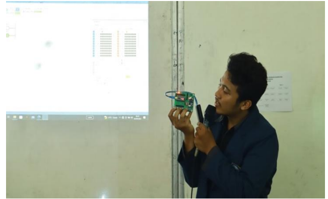
Gambar 3. Pemateri Menjelaskan Kinerja PLC

Gambar 3 menjelaskan bagaimana kinerja PLC sesuai mengirim programnya ke Hardware, dengan cara menekan tombol push button untuk menyalakan lampu.