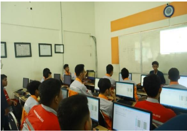
Gambar 1. Peserta Pelatihan Mengikuti Arahan

selesai. Hasil kuisioner memperlihatkan bahwa siswa-siswi memahami dasar dari SCADA dan merasa menambah ilmu dan wawasan baru yang belum pernah diajarkan di sekolah. Mereka juga menginginkan pelatihan lanjutan untuk memahami lebih lanjut agar dapat menguasai teknologi SCADA dengan lengkap. Gambar 1 dan gambar 2 memperlihatkan peserta terlibat dalam pelatihan bersama pemateri. Program pelatihan ini dilakukan oleh mahasiswa KKN yang dalam pengawasan dosen agar siswa-siswi yang mengalami kesulitan dapat diatasi langsung oleh mahasiswa yang telah di training sebelumnya agar supaya tidak tertinggal dalam menjalankan langkah-langkah yang disusun.