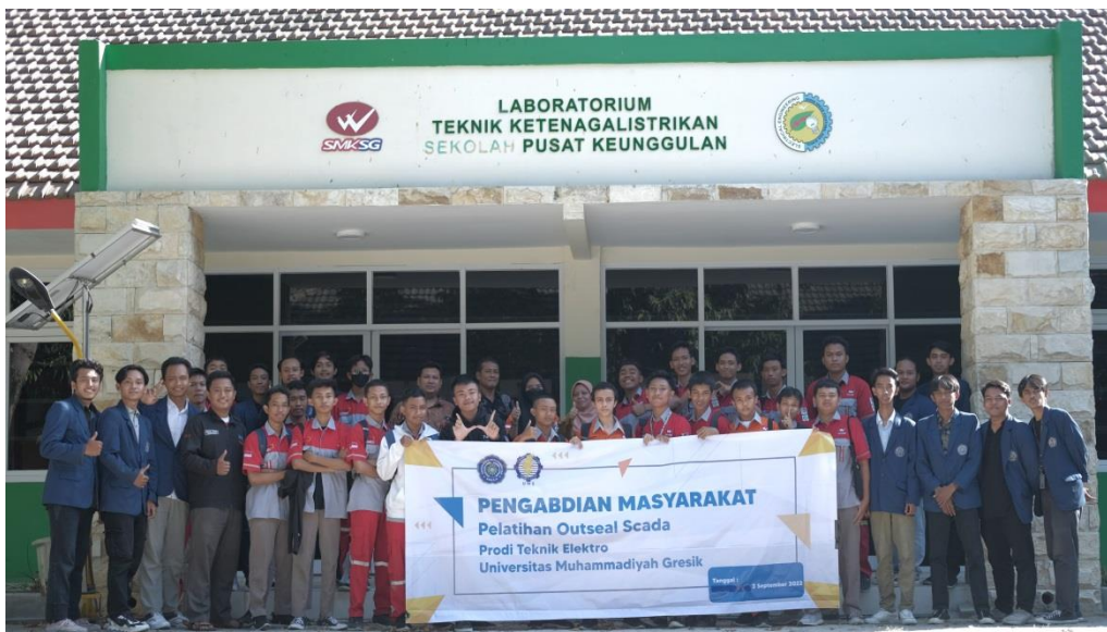
Gambar 5. Foto Bersama Siswa-Siswi, Guru SMK Semen Gresik dan Tim beserta Mahasiswa