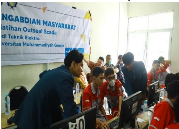
Gambar 2. Keterlibatan Peserta dalam Pelatihan