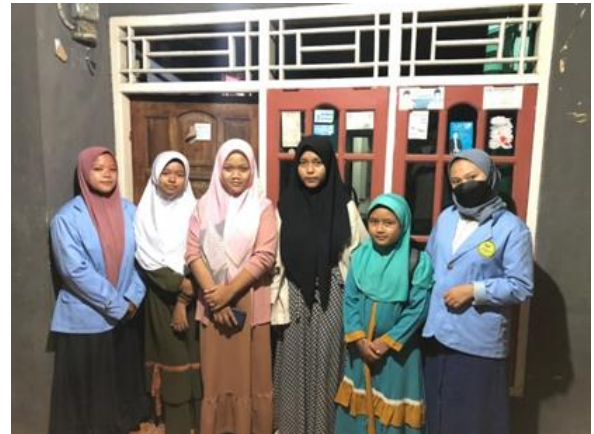
Gambar 4. Program Pelaksanaan Bimbingan belajar anak-anak di Desa Benteng

Pada kegiatan bimbingan belajar terdapat beberapa hambatan yang ditemui yakni tingkat konsentrasi anak yang tidak stabil karena aspek lingkungan yang kurang kondusif dan variasi metode belajar yang terkesan monoton. Dalam bimbingan belajar, hal yang peneliti lakukan dalam membangun motivasi belajar anak diantaranya: