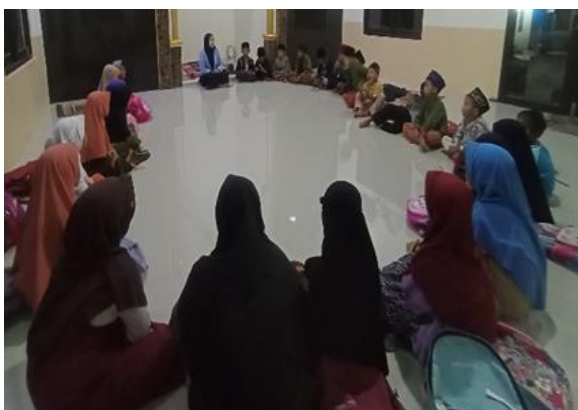
Gambar 3. Program Pelaksanaan Bimbingan belajar anak-anak di Desa Benteng