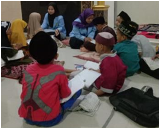
Gambar 2. Program Pelaksanaan Bimbingan belajar anak-anak di Desa Benteng