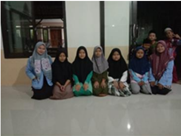
Gambar 1. Kegiatan observasi awal kegiatan peningkatan motivasi belajar anak-anak di Desa Benteng.