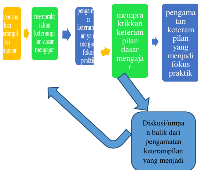
Gambar 1. Tahap pelaksanaan pelatihan

Sehingga berdasarkan fakta tersebut perlu adanya pelatihan keterampilan dasar mengajar yang dilakukan secara kontinu yang dapat dilakukan dengan cara memberikan pembimbingan. Dalam proses pembimbingan ada pembimbing memberi kesempatan kepada mahasiswa melatih semua keterampilan dasar mengajar dan mengamati secara komprehensif semua jenis keterampilan tersebut. Sebaiknya