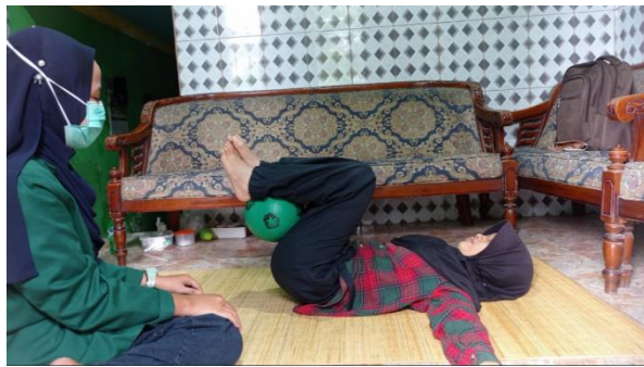
Gambar 2 : Foto pelatihan abdominal stretching