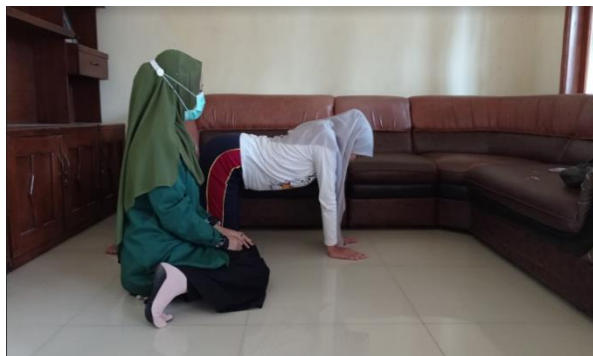
Gambar 3 : Foto pelatihan abdominal stretching