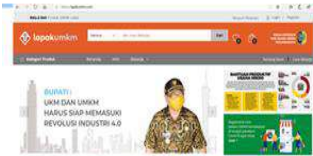
Gambar 6. Halaman Utama Website ( https://lapakumkm.com/ )

Dalam memberikan pelatihan tersebut, tim LAPAKUMKM menekankan pentingnya penguatan strategi pemasaran ditengah kondisi Pandemic Covid-19 atau di era new normal seperti saat ini. Selain itu tim LAPAKUMKM juga memperkenalkan website milik LAPAKUMKM beserta cara-cara untuk memasarkan produk-produk milik pelaku UMKM desa Gondosuli melalui website LAPAKUMKM ( https://lapakumkm.com/ ).