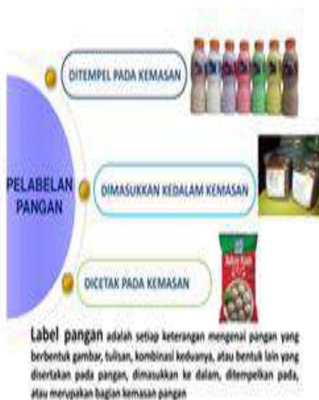
Gambar 30. Pelabelan Pangan (sumber materi Dinkes Kabupaten Tulungagung)

Setelah SPP-IRT diterbitkan pastinya produk yang telah diproduksi akan diberikan sebuah label. Dalam rangka itu pada rangkaian kegiatan PKM terintegrasi KKN ini, pihak Dinkes kabupaten Tulungagung juga memberikan sosialisasi tentang penting-tidaknya sebuah label pada produk pangan. Menurut materi yang disampaikan oleh Dinkes dalam sosialisasi tersebut, bahwa label pangan ini sangat bermanfaat sebagai sarana komunikasi produsen-konsumen, penentu keputusan ‘membeli’ bagi konsumen, menciptakan perdagangan yang adil, jujur dan bertanggung jawab serta melindungi konsumen.