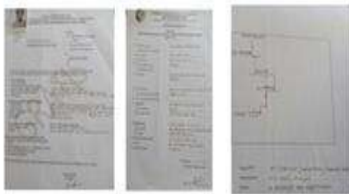
Gambar 22 & 23. Contoh Surat permohonan, formulir permohonan dan denah lokasi & denah bangunan (sumber materi Dinkes Kabupaten Tulungagung)

Pada topik materi sosialisasi tentang tata cara pengajuan ijin edar dijelaskan secara detail juga tentang persyaratan yang wajib dipenuhi oleh pengaju, diantaranya 1. Fotokopi kartu tanda penduduk (KTP) pemilik usaha rumahan, 2. Pasfoto 3x4 pemilik usaha rumahan, 3 lembar, 3. Surat keterangan domisili usaha dari kantor camat, 4. Denah lokasi dan denah bangunan, 5. Surat keterangan puskesmas atau dokter untuk pemeriksaan kesehatan dan sanitasi, 6. Surat permohonan izin produksi makanan atau minuman kepada Dinas Kesehatan, 7. Data produk makanan atau minuman yang diproduksi, 8. Sampel hasil produksi makanan atau minuman yang diproduksi, 9. Label yang akan dipakai pada produk makanan minuman yang diproduksi, 10. Menyertakan hasil uji laboratorium yang disarankan oleh Dinas Kesehatan dan 11. Mengikuti Penyuluhan Keamanan Pangan untuk mendapatkan SPP-IRT.