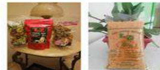
Gambar 13 & 14. Contoh Pengolahan Produk secara Inovatif (Pengemasan)