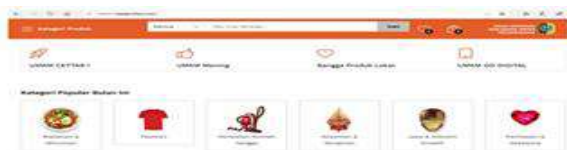
Gambar 7. Halaman Kategori Produk ( https://lapakumkm.com/ )

Isi dari website LAPAKUMKM ( https://lapakumkm.com/ ) tersebut cukup beragam, mulai dari kategori produk yang dipasarkan dalam website tersebut, ketentuan bagi setiap pembeli/konsumen mulai dari cara belanja, pembayaran, jaminan aman dan jasa bagi pembeli hingga ketentuan bagi setiap penjual yang mencakup cara berjualan, keuntungan berjualan, indeks merek dan direktori pelapak.