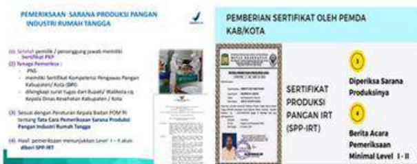
Gambar 28 & 29. pemeriksaan sarana produksi pangan industri rumah tangga dan pemberian sertifikat oleh pemda kabupaten

Setelah SPP-IRT diterbitkan pastinya produk yang telah diproduksi akan diberikan sebuah label. Dalam rangka itu pada rangkaian kegiatan PKM terintegrasi KKN ini, pihak Dinkes kabupaten Tulungagung juga memberikan sosialisasi tentang penting-tidaknya sebuah label pada produk pangan. Menurut materi yang disampaikan oleh Dinkes dalam sosialisasi tersebut, bahwa label pangan ini sangat bermanfaat sebagai sarana komunikasi produsen-konsumen, penentu keputusan ‘membeli’ bagi konsumen, menciptakan perdagangan yang adil, jujur dan bertanggung jawab serta melindungi konsumen.