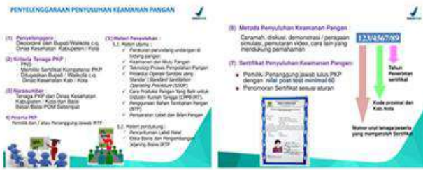
Gambar 26 & 27. Petunjuk penyelenggaraan penyuluhan keamanan pangan

telah berakhir, pangan produksi IRTP dilarang untuk diedarkan.