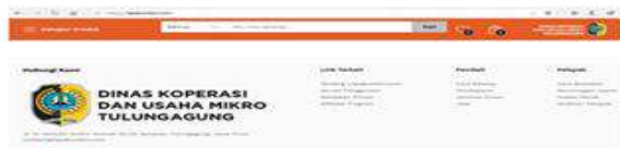
Gambar 8. Halaman Ketentuan Pembeli Dan Penjual ( https://lapakumkm.com/ )

Pelatihan yang diberikan oleh tim LAPAKUMKM ini selain memberikan ilmu dan wawasan yang baru tentang bagaimana membangun sebuah website dan cara pengelolaannya sebagai media promosi produk/ layanan yang lebih banyak dikenal masyarakat luas juga memotivasi BUMDes, Karang Taruna dan para pelaku UMKM dalam mengoptimalkan peranya dalam melaksanakan penguatan strategi pemasaran atas produk-produk kreatif dan lokal desa Gondosuli.