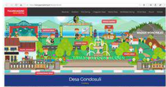
Gambar 3. Website desa ( https://tulungagungdaring.id/desa/gondosuli/ )

telah ada, namun saat ini kegunaan website desa tersebut hanya sebatas untuk laporan administrasi desa saja.