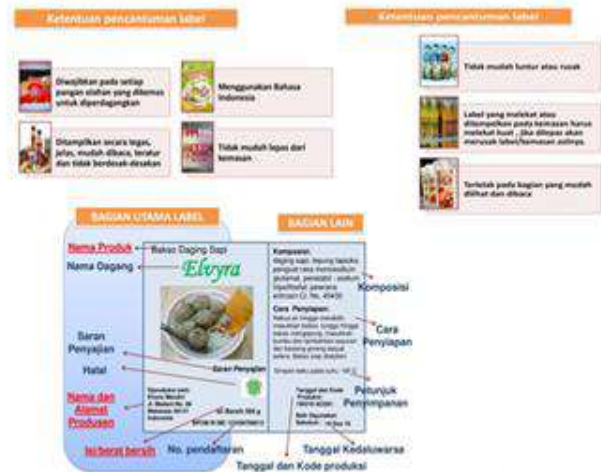
Gambar 31, 32 & 33. Ketentuan pencantuman label & muatan bagian utama label (sumber materi Dinkes Kabupaten Tulungagung)

Sesuai dengan undang-undang nomor 18 tahun 2012 tentang Pangan disebutkan bahwa keterangan pada label sekurang-kurangnya memuat; 1.nama produk 2. daftar bahan yang digunakan/komposisi 3. berat bersih atau isi bersih 4. nama dan alamat pihak yang memproduksi atau mengimpor 5. halal bagi yang dipersyaratkan 6. tanggal dan kode produksi 7. tanggal, bulan, dan tahun kedaluwarsa 8. nomor izin edar 9. asal usul bahan pangan tertentu; • asal bahan: protein kedelai, lemak babi. • proses khusus, seperti jagung pangan produk rekayasa genetik/jagung pangan PRG, tahun pangan iradiasi. Selain itu ada beberapa ketentuan yang harus/wajib dimuat dalam sebuah label pangan, diantaranya pencantuman kode produksi, pencantuman keterangan kedaluwarsa, petunjuk penyimpanan, ketentuan tentang tulisan dan gambar yang ada pada label, tulisan halal, informasi nilai gizi pada label pangan, informasi tanpa bahan tambahan pangan pada label dan iklan pangan. Juga hal-hal yang dilarang untuk dimuat dalam label pangan, misal tulisan yang dilarang dicantumkan dan gambar yang tidak boleh dicantumkan.