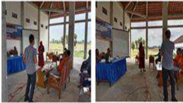
Gambar 34 & 35. Sesi tanya jawab dengan Bpk. Masduki Kasi Perbekalan dan Farmasi Dinkes kabupaten Tulungagung

memberikan kesempatan kepada peserta untuk menjawab pertanyaan tersebut.