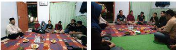
Gambar 1 & 2. Diskusi dan konsultasi perihal permasalahan persaingan usaha antara dua (2) dusun di desa Gondosuli sebagai penghasil produk UMKM bersama perangkat desa dan pengurus BUMDes serta Karang Taruna

Langkah pendekatan melalui konsultasi dan diskusi bersama dilakukan dalam permasalahan ini, tentunya dengan melibatkan peranan perangkat desa dan pengurus BUMDes serta karang taruna pada sesi ini, yang mana ternyata permasalahan persaingan pelaku usaha UMKM yang ada pada dua dusun dari desa Gondosuli ini adalah permasalahan yang sangat klasik. Penyebab timbulnya permasalahan ini adalah karena produk yang sama yang dihasilkan oleh para pelaku UMKM dari ke dua dusun tersebut.