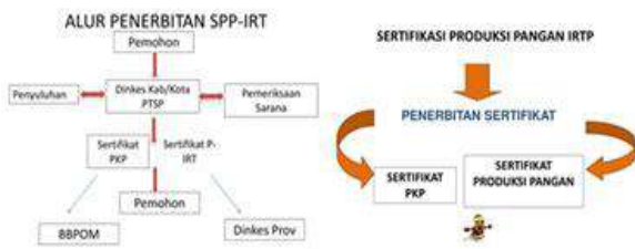
Gambar 20 & 21. Alur penerbitan SPP-IRT & Sertifikasi Produksi Pangan IRTP (sumber materi Dinkes Kabupaten Tulungagung)

Pada topik materi sosialisasi tentang tata cara pengajuan ijin edar dijelaskan secara detail juga tentang persyaratan yang wajib dipenuhi oleh pengaju, diantaranya 1. Fotokopi kartu tanda penduduk (KTP) pemilik usaha rumahan, 2. Pasfoto 3x4 pemilik usaha rumahan, 3 lembar, 3. Surat keterangan domisili usaha dari kantor camat, 4. Denah lokasi dan denah bangunan, 5. Surat keterangan puskesmas atau dokter untuk pemeriksaan kesehatan dan sanitasi, 6. Surat permohonan izin produksi makanan atau minuman kepada Dinas Kesehatan, 7. Data produk makanan atau minuman yang diproduksi, 8. Sampel hasil produksi makanan atau minuman yang diproduksi, 9. Label yang akan dipakai pada produk makanan minuman yang diproduksi, 10. Menyertakan hasil uji laboratorium yang disarankan oleh Dinas Kesehatan dan 11. Mengikuti Penyuluhan Keamanan Pangan untuk mendapatkan SPP-IRT.