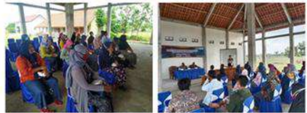
Gambar 9 & 10. Sosialisasi Pengolahan Produk secara Inovatif oleh Tim PKM

Selain mengundang tim LAPAKUMKM untuk memberikan pelatihan dalam memaksimalkan fasilitas IT dan website desa Gondosuli, untuk mendukung kegiatan tersebut tim PKM juga berkesempatan untuk memberikan sosialisasi terkait pengolahan produk secara inovatif. Sosialisasi pengolahan produk secara inovatif ini diberikan terbatas pada pengemasan dan penyajian produk yang inovatif untuk memberikan nilai jual yang lebih atas produk yang dihasilkan oleh para pelaku UMKM desa Gondosuli.