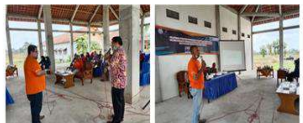
Gambar 4 & 5. Pelatihan oleh Tim LAPAKUMKM

Dikarenakan waktu yang relatif singkat dalam melaksanakan kegiatan PKM terintegrasi KKN ini, maka untuk mewujudkan pelatihan dalam memaksimalkan fasilitas IT dan website desa Gondosuli tersebut, tim PKM berinisiatif mengundang tim LAPAKUMKM yang telah diluncurkan oleh pemerintah kabupaten Tulungagung. Pelatihan yang diberikan oleh tim LAPAKUMKM akan memotivasi dan memberikan wawasan kepada BUMDes dan Karang Taruna desa Gondosuli untuk lebih mengoptimalkan peranya dalam memperkenalkan produk-produk lokal dari para pelaku UMKM yang ada di desa Gondosuli, tentunya dengan cara memaksimalkan fasilitas IT dan website desa Gondosuli.