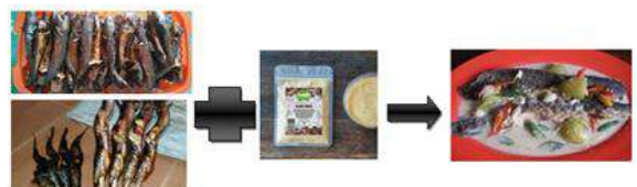
Gambar 17. Contoh Pengolahan Produk secara Inovatif lele asap yang disajikan dengan bumbu ekstrak/berupa serbuk sehingga menjadi masakan khas Gondosuli, yakni pecel lele (Penyajian)