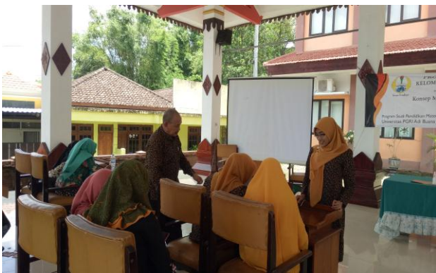
Gambar 2. Diskusi selama kegiatan PKM

Gambar 1 menunjukkan kegiatan pembukaan yang dilakukan oleh tim dosen pendidikan matematika Universitas PGRI Adi Buana Surabaya. Dihadiri oleh seluruh peserta Bunda PAUD se-kecamatan Gondang. Kegiatan diawali dengan sambutan oleh Kaprodi Pendidikan Matematika, kemudian dilanjutkan oleh sambutan dari Bapak Camat sekaligus membuka acara pengabdian kepada masyarakat.