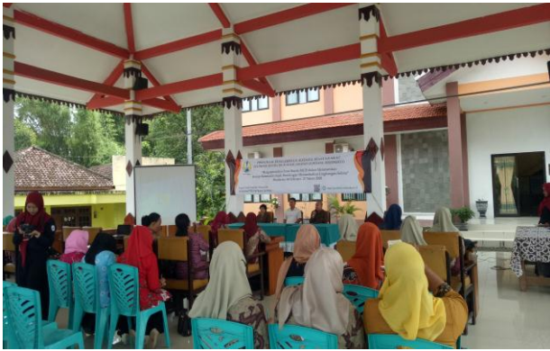
Gambar 1. Pembukaan kegiatan PKM

Gambar 1 menunjukkan kegiatan pembukaan yang dilakukan oleh tim dosen pendidikan matematika Universitas PGRI Adi Buana Surabaya. Dihadiri oleh seluruh peserta Bunda PAUD se-kecamatan Gondang. Kegiatan diawali dengan sambutan oleh Kaprodi Pendidikan Matematika, kemudian dilanjutkan oleh sambutan dari Bapak Camat sekaligus membuka acara pengabdian kepada masyarakat.