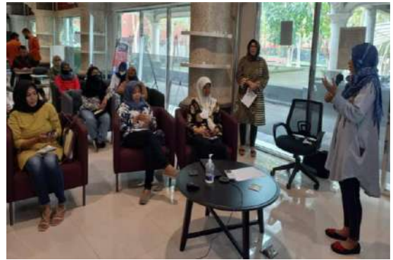
Gambar 2 : Pelatihan Pembuatan Editing Video