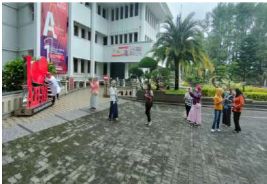
Gambar 7: Praktek Outdoor Pembuatan Editing Video