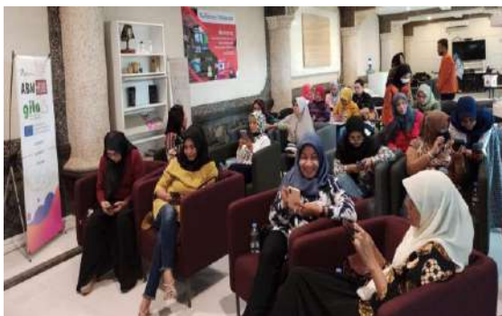
Gambar 6: Praktek Pembuatan Editing Video