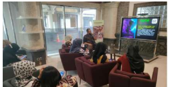
Gambar 3: Ceramah Pembuatan Editing Video