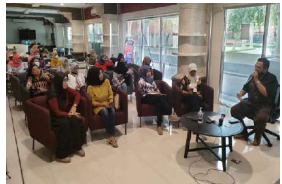
Gambar 4: Diskusi dan Tanya Jawab Pembuatan Editing Video