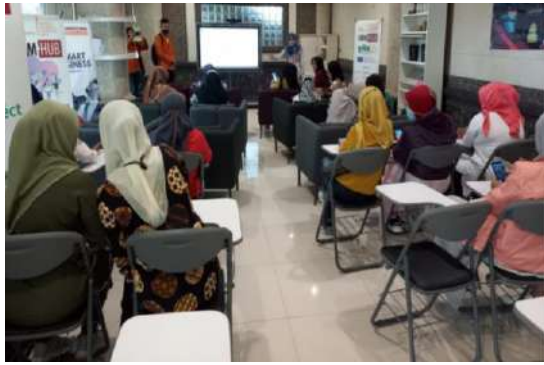
Gambar 5: Praktek Pembuatan Editing Video