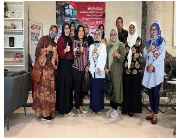
Gambar 8 : Foto Bersama Pelatihan Pembuatan Editing Video